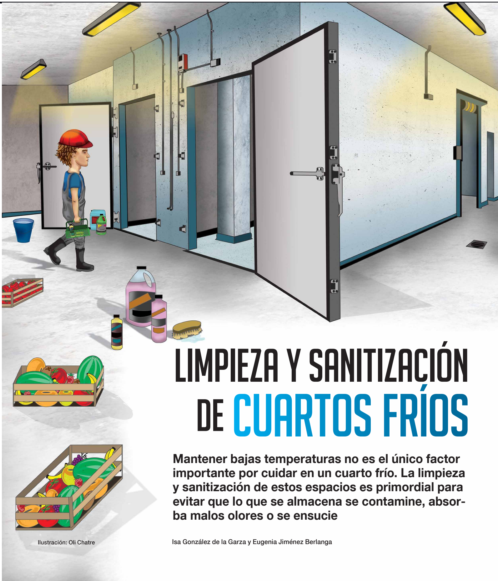
Ilustración: Oli Chatre